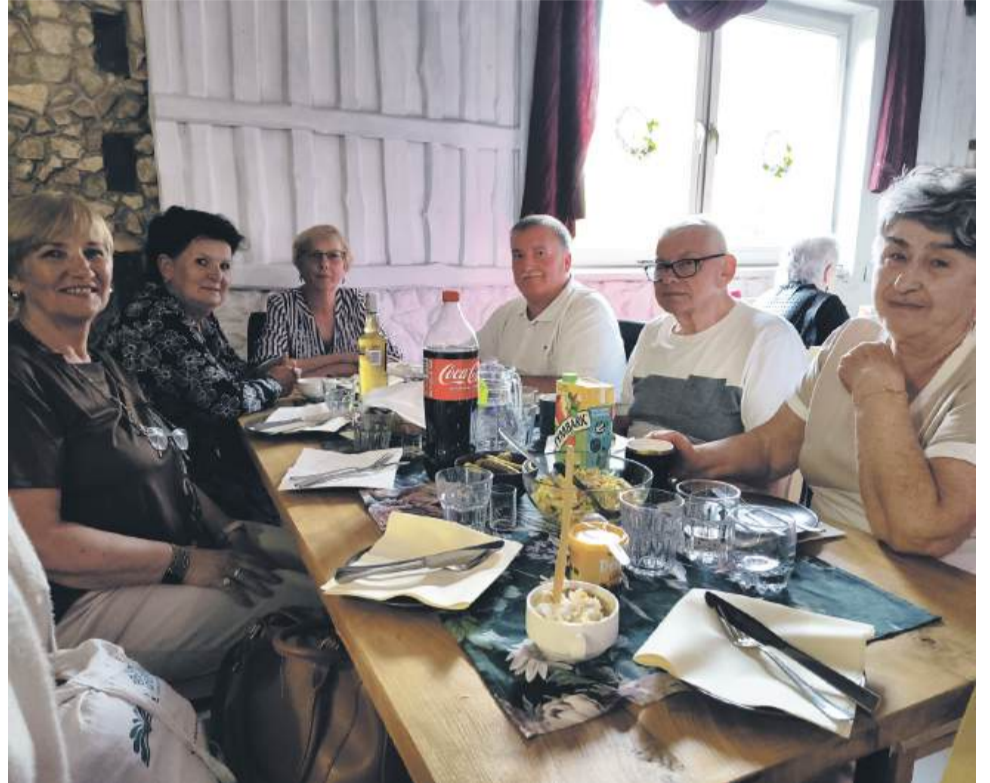
Część uczestników wydarzenia

Po oficjalnym otwarciu rozpoczęła się część rekreacyjna spotkania. Uczestnicy bawili się przy muzyce na żywo, korzystając jednocześnie z przygotowanego poczęstunku