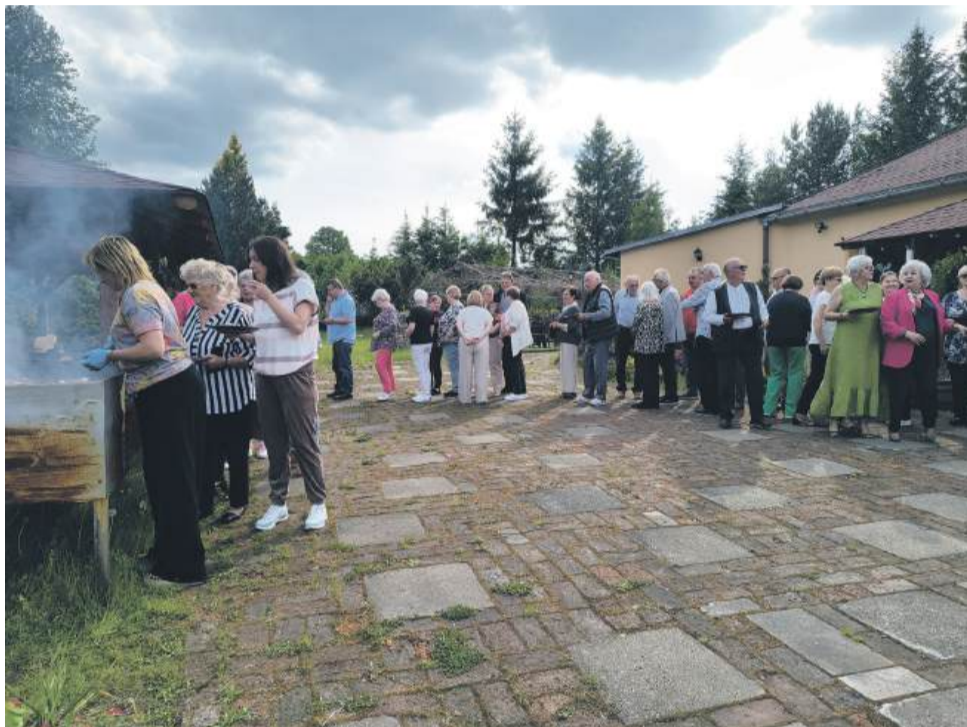
Za czym kolejka ta stoi? Za grillem, za grillem...