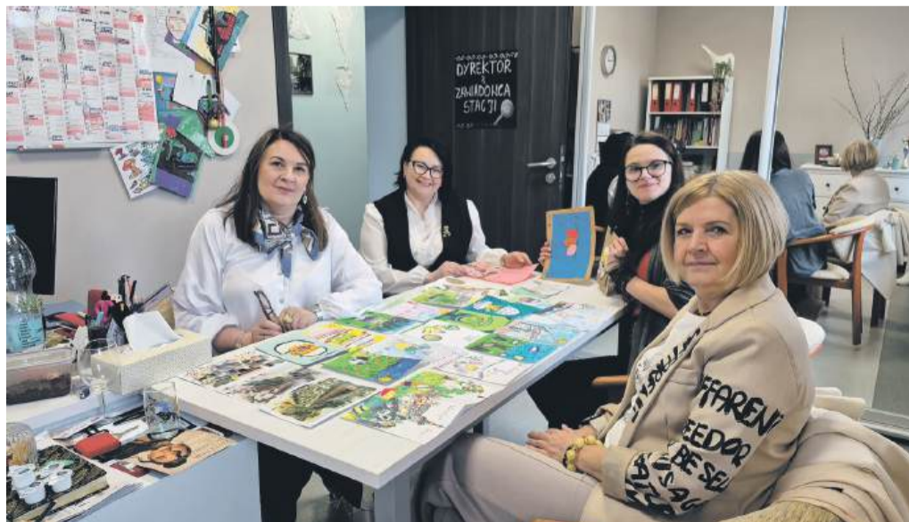
Komisja konkursowa podczas obrad

Serdecznie dziękujemy wszystkim dzieciom za zaangażowanie, pomysłowość i serce włożone w przygotowanie prac. To dzięki Wam tegoroczna edycja konkursu była tak barwna i inspirująca.