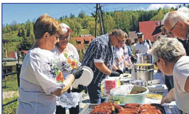
KGW "My, Dziewczyny z Czerniawy" na otwarciu parku w Czerniawie-Zdroju

Zdaje mi się, że obecnie Izerski Klub Międzypokoleniowy przekształcił się w namiastkę Uniwersytetu Trzeciego Wieku – i to też jest super. Wykłady, zajęcia, warsztaty, spotkania literackie... Biblioteka Izerka dba o różnorod-