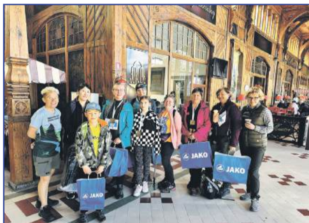
Kreatywni i Aktywni na Festiwalu Nordic Walking 2025

„Jesteśmy stowarzyszeniem zwykłym, które jest dla wszystkich ludzi” – reklamują się Kreatywni i Aktywni Świeradów-Zdrój na swojej stronie na Facebooku. To młode stowarzyszenie, ma zaledwie dwa lata, a już zdążyło mocno zaznaczyć swoją obecność w lokalnej społeczności.