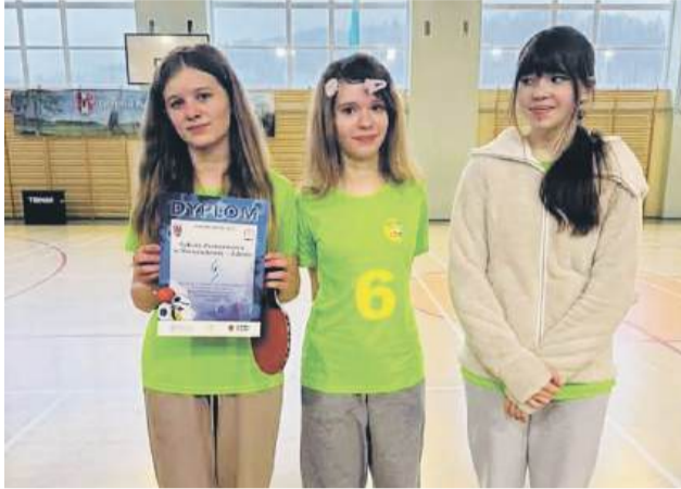
Zawody tenisa stołowego Strefy Jeleniogórskiej

dla zdrowia i sprawności człowieka, a także spróbować swoich sił podczas wykonywania prostych zabiegów.