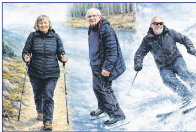
Bycie outsiderem nie oznacza samotnego przesiadywania w fotelu! Rycina wygenerowana przez AI. Przykładowa ilustracja aktywnych seniorów w górach. Wszelkie podobieństwo do rzeczywistych osób i miejsc jest przypadkowe... ;)