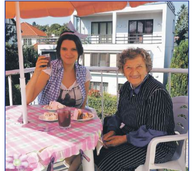
Hela i Asia, Gdańsk 2014