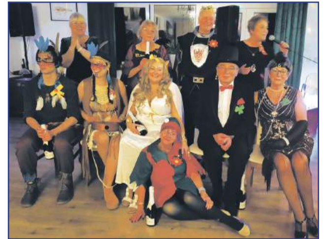
Bal Karnawałowy ISAR 2026