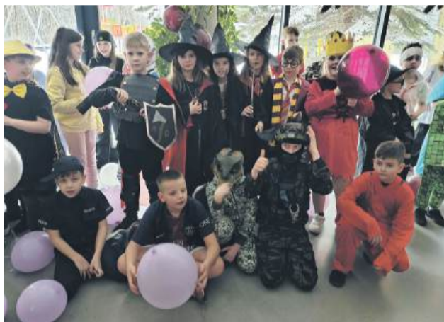
Zabawa karnawałowa