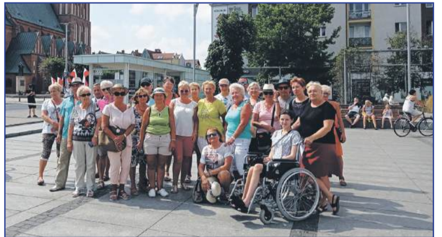
Wczasowicze na wycieczce w Koszalinie w trakcie pobytu w Mielnie 2022

W tym roku zaś zaplanowane są Wicie (7–21 czerwca) oraz Pobierowo (18–30 sierpnia). Tego typu wyjazd zawsze obejmuje dwie imprezy integracyjne – jedną z muzyką, drugą z ogniskiem lub rybką.