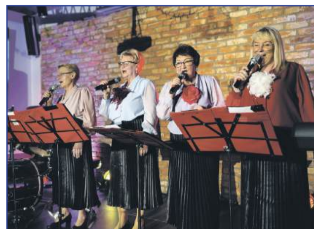
Zespół Wokalny Syntonia na Dniu Kobiet w Stacji Kultury 2026