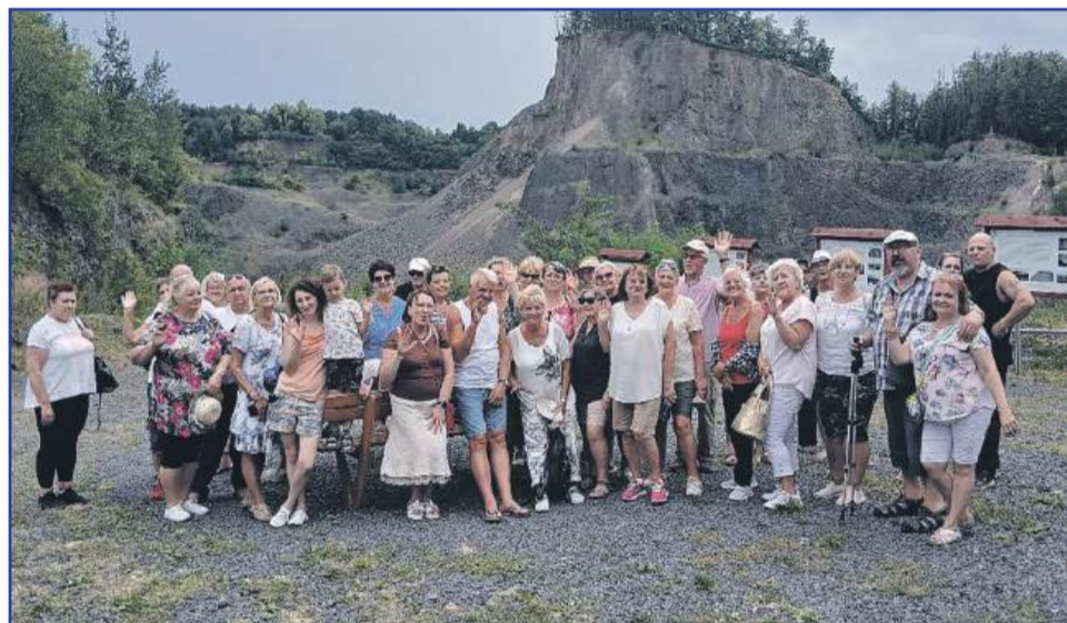
ISAR na wycieczce w Rezerwacie Geologicznym „Wilkołak”, sierpień 2024