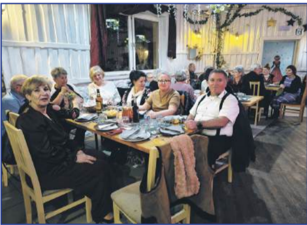
Spotkanie Oplatkowe PZERiI 2026

– Dziewczyno, powiecie mi coś o tej balandze u Emerytów?