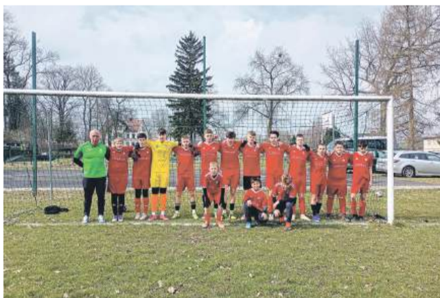
Na zdjęciach nasze kluby sportowe. Od góry: KS Samuraj, FROGS Ski & Sun oraz TKKF KWISA

Na realizację tego zadania Gmina przeznaczyła w tym roku 180 000,00 zł - głównie na działania sportowe dla dzieci i młodzieży finansowane ze środków tzw. AA. Termin składania ofert upływa 1 kwietnia 2026 r. o godz. 14:00. Oferty należy składać papierowo w Urzędzie Miasta Świeradow-Zdrój. W celu uzyskania rzetelnych informacji, zawsze warto kierować pytania bezpośrednio do źródła, co pozwoli uniknąć nieporozumień oraz zbędnych emocji. Publikowanie nieprawdziwych informacji w przestrzeni publicznej wprowadza w błąd, wprowadza niepotrzeb-