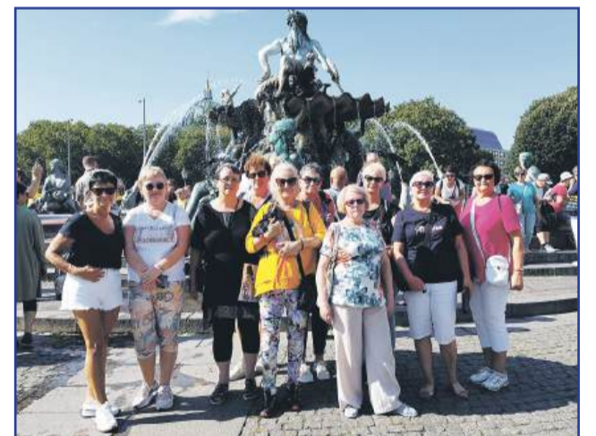
Członkinie ISAR na wycieczce w Berlinie, 2023 r.

W tym roku postanowiłam także przygotować kostium. Na poprzednim balu nie byłam przebrana i przyznam, że było mi trochę niezręcznie, bo wiele senierek wystąpiło wtedy w pięknych, pomysłowych strojach. Tym razem pojawiłam się więc jako grecka bogini. Blond peruka zrobiła taką „robotę”, że na początku nikt mnie nie rozpoznał. Co ciekawe, seniorzy bardzo