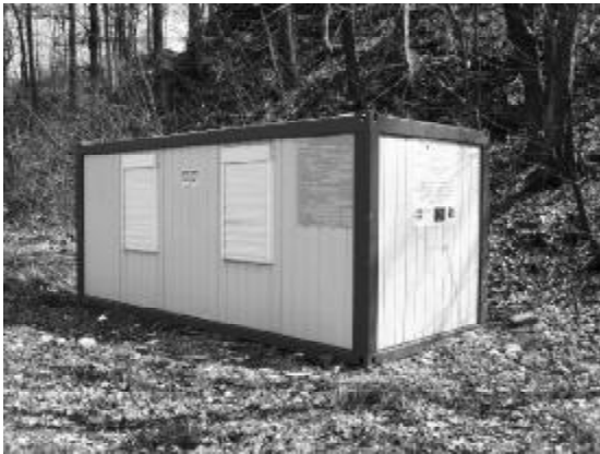
Tu na razie jest ściernisko... - pierwszy barak na placu budowy oczyszczalni

12 kwietnia wykonawcy został przekazany plac budowy.