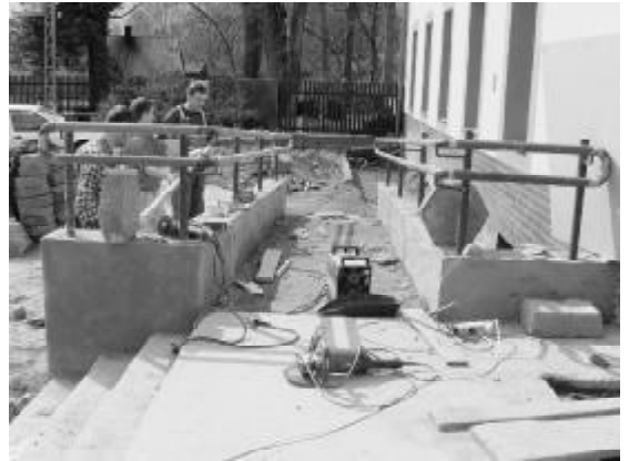
Izerskie Centrum 21 kwietnia br. U góry budowa podjazdu dla osób niepełnosprawnych. U dołu - montaż windy.

szych kierowców nadeszła z Dolnośląskiego Zarządu Dróg Wojewódzkich we Wrocławiu. Zarządca drogi wojewódzkiej nr 361 ogłosił przetarg na modernizację drogi na odcinku Krzewie Wlk. - Proszówka (do skrzyżowania z drogą do Młynska). Zakres robót obejmuje modernizację 3 km drogi, zlikwidowane zostaną przełomy, wykonane nowe przepusty, odbudowana funkcjonalność rowów odwadniających, poszerzona zostanie też jezdnia na niektórych fragmentach trasy oraz wykonana nowa nawierzchnia na całym odcinku. Termin składania ofert w